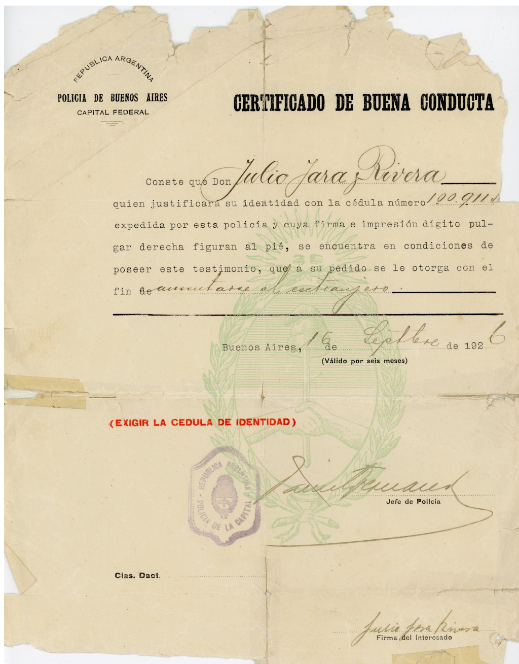
Figura 4. Certificado de buena conducta. Gentileza familia Ruiz Jara. Archivo personal D. Ivanoff

Aysenología 3:48-51 Año 2017 Versión impresa ISSN 0719-7497 Versión online ISSN 0719-6849