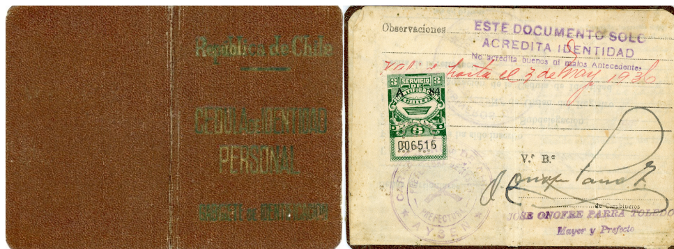
Figura 2. Cédula de identidad (exterior e interior) del poblador Cantalicio Jara.

Aysenología 3:48-51 Año 2017 Versión impresa ISSN 0719-7497 Versión online ISSN 0719-6849