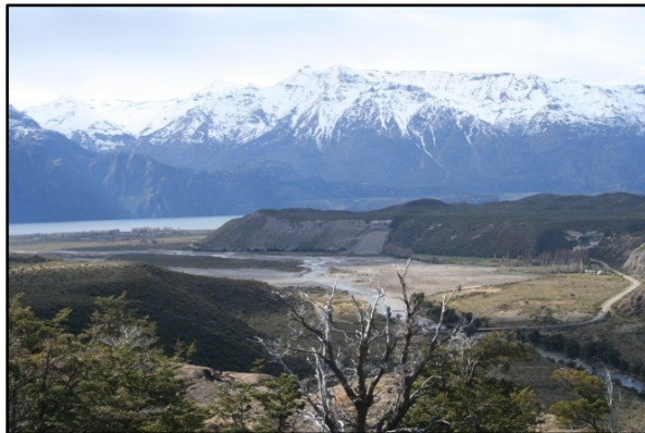
Figura 2. Al fondo, Fachinal, planicie lacustre. Derecha Ruta X-265 y Río Avilés. Fuente: fotografía de los autores (septiembre 2013).

En las siguientes páginas se describen algunas de las características constitutivas del grupo humano que queda en Fachinal y su interrelación con los recursos naturales para el desarrollo y sustento de su modo de vida, considerando su historia, sus relaciones económicas y manifestaciones culturales compartidas dentro de los espacios territoriales en común.